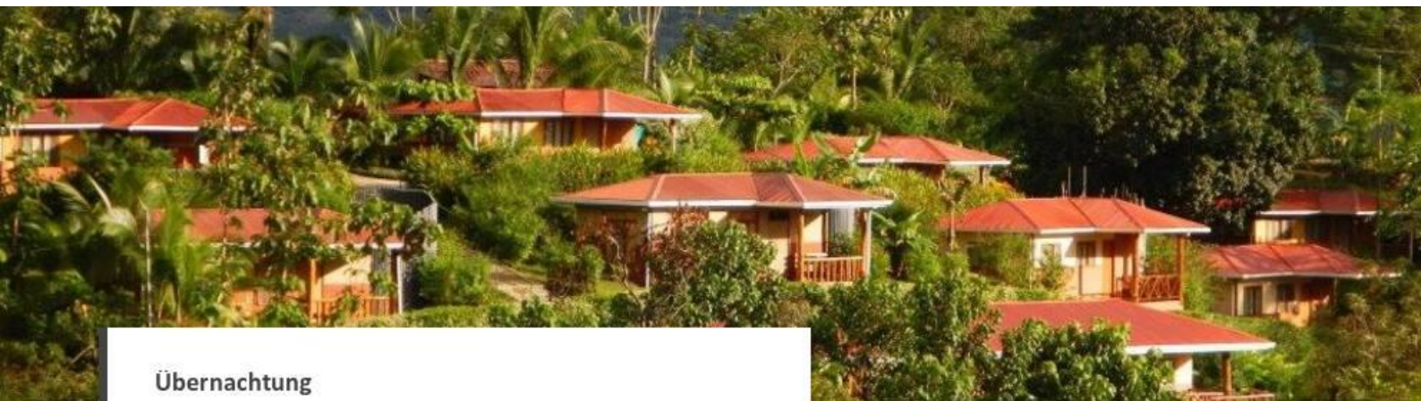
Übernachtung Hotel Cerro Lodge

Das Hotel Cerro Lodge liegt in der zentralpazifischen Region Costa Ricas in der Nähe des Carara-Nationalparks am Tarcoles-Fluss. Die Zimmer sind alle mit einem eigenen Bad mit Dusche, Klimaanlage und täglichem