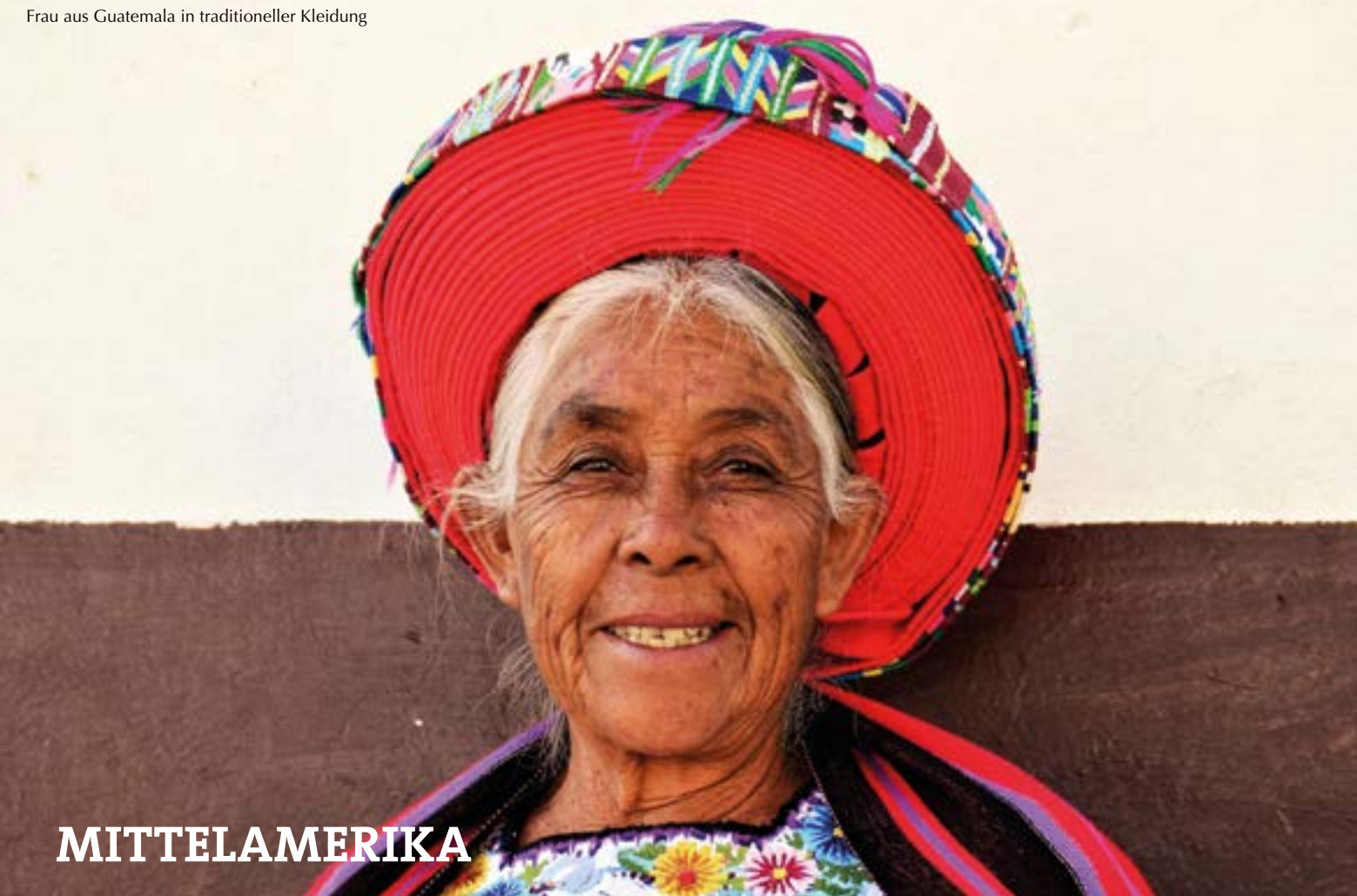
Frau aus Guatemala in traditioneller Kleidung