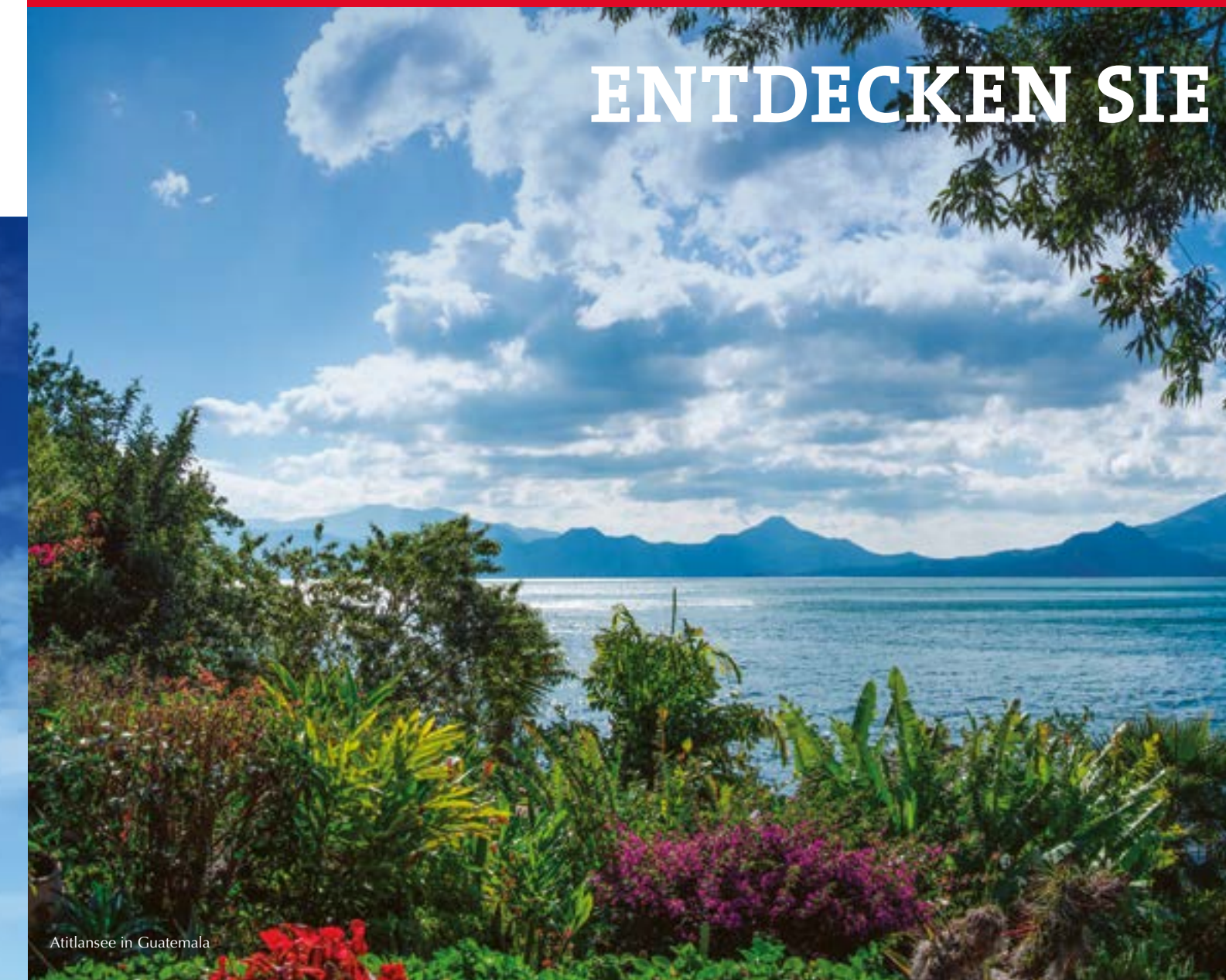
Atitlansee in Guatemala

Faszination, Leidenschaft, Begeisterung, die Wunder der Natur genießen, unvergessliche Orte als Pionier entdecken, aktiv zu Fuß, per Rad oder auf dem Wasser, interessanten Menschen und Kulturen begegnen, eintauchen in die Seele eines Landes, über alte Traditionen staunen und sich von neuen Horizonten inspirieren lassen