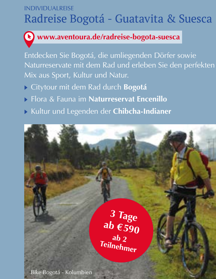
Radreise Bogotá - Guatavita & Suesca