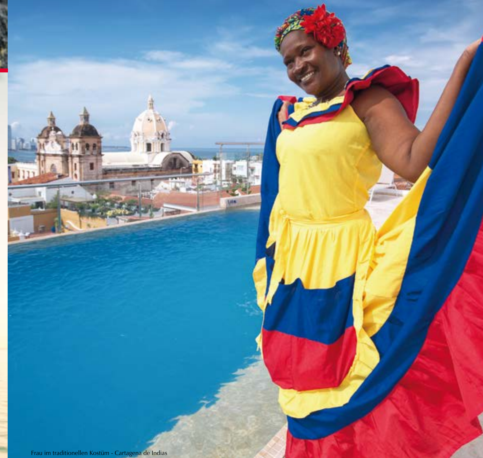
Frau im traditionellen Kostüm - Cartagena de Indias