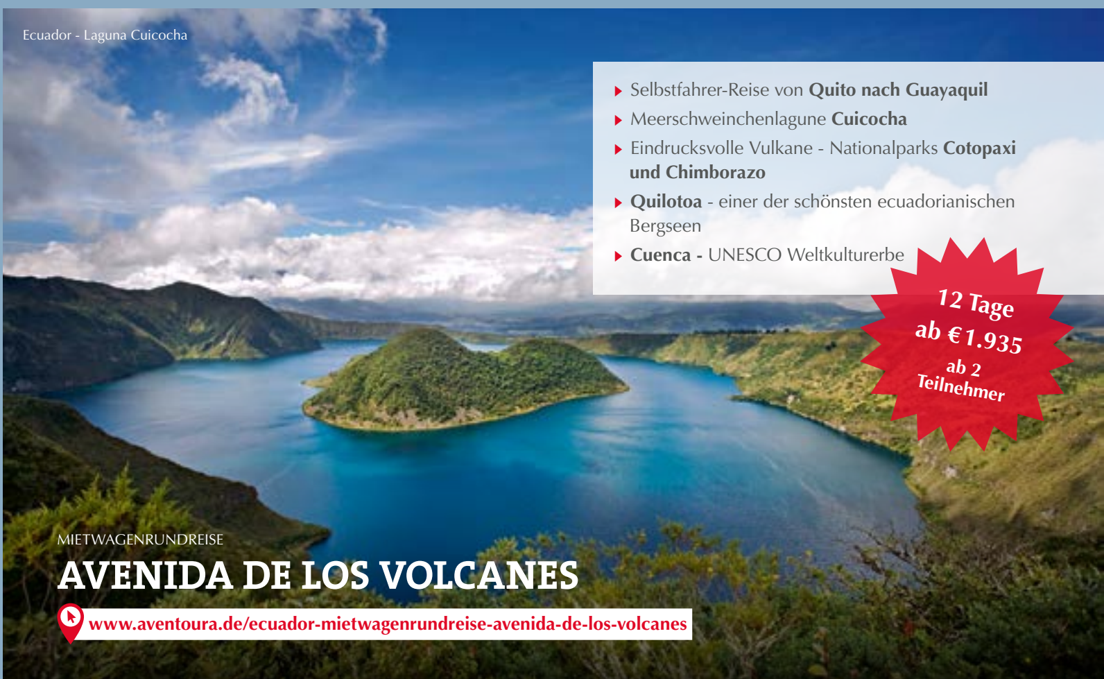
Ecuador - Laguna Cuicocha