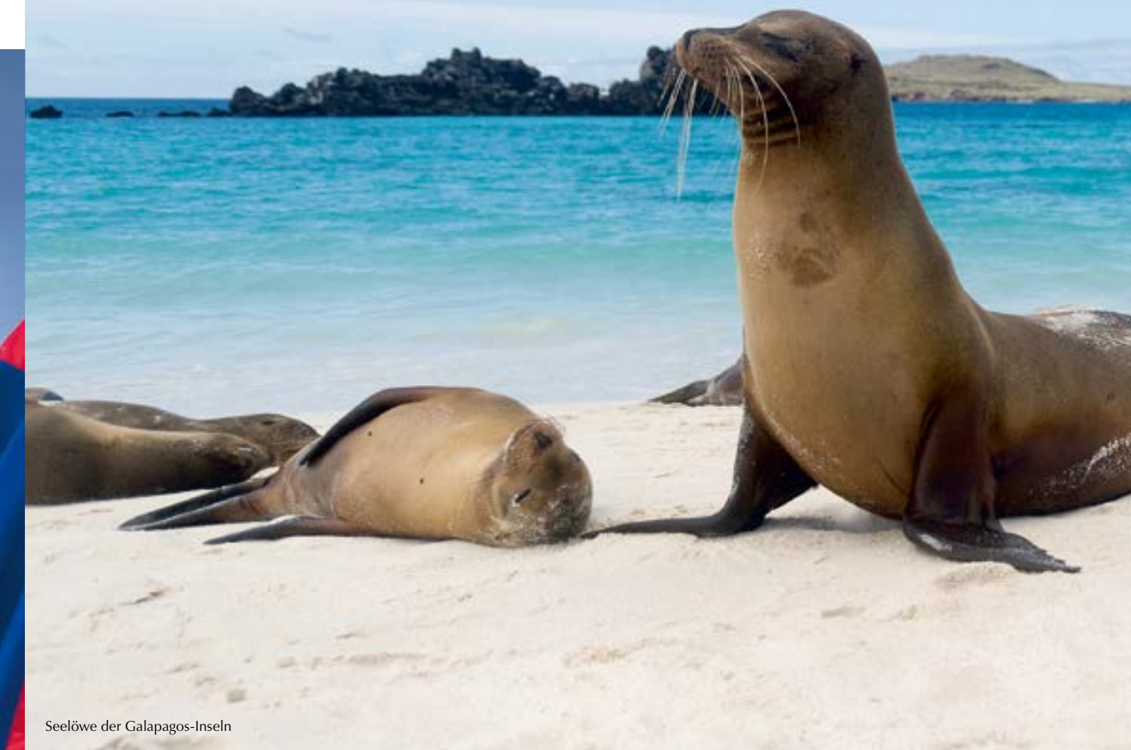
Seelöwe der Galapagos-Inseln

Faszination, Leidenschaft, Begeisterung, die Wunder der Natur genießen, unvergessliche Orte als Pionier entdecken, aktiv zu Fuß, per Rad oder auf dem Wasser, interessanten Menschen und Kulturen begegnen, eintauchen in die Seele eines Landes, über alte Traditionen staunen und sich von neuen Horizonten inspirieren lassen