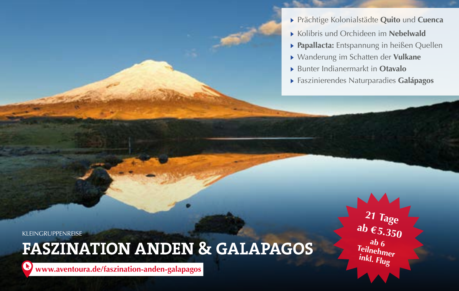
Der Vulkan Cotopaxi