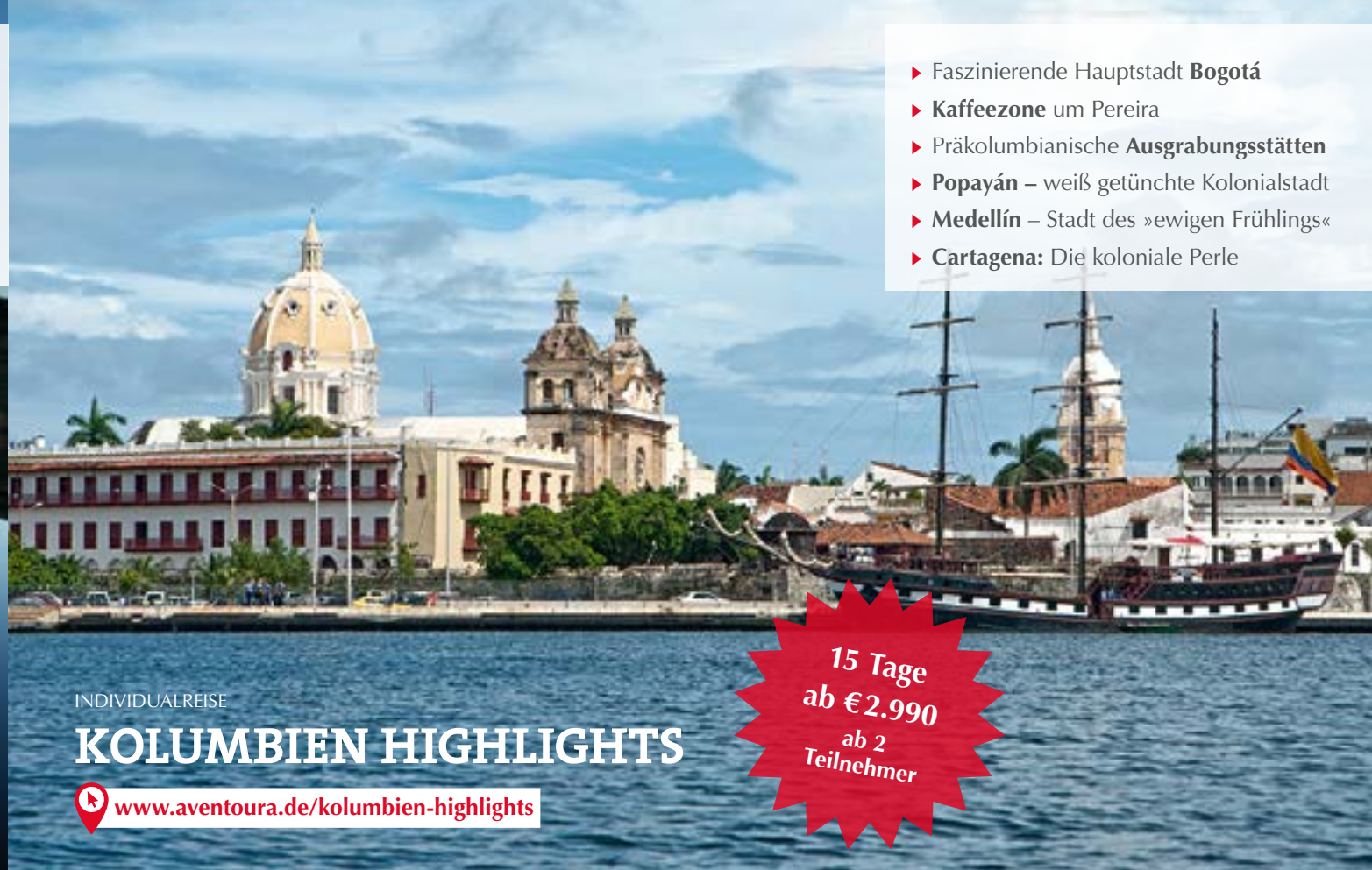
Cartagena: Die Koloniale Perle der Karibik

21 Tage ab € 5.350 ab 6 Teilnehmer inkl. Flug