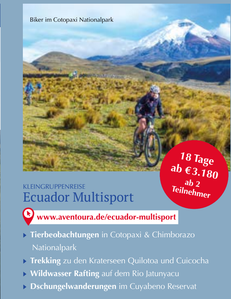
Biker im Cotopaxi Nationalpark